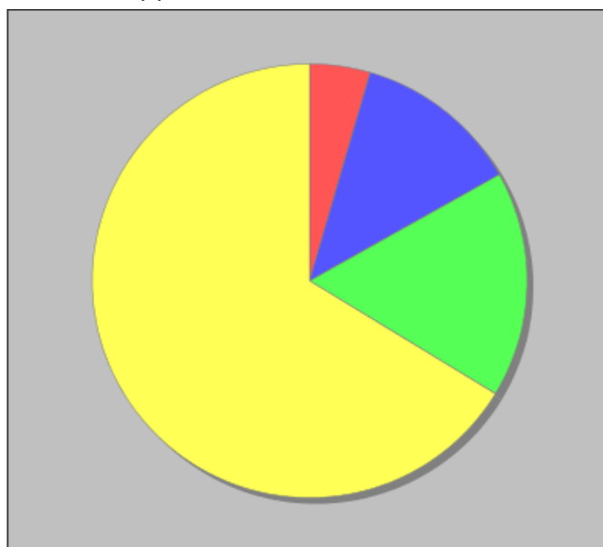
Distribuzione dei docenti a T.I. per anzianità nel ruolo di appartenenza (riferita all'ultimo ruolo)